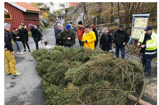
Bild från förra årets granresning. Den 28 november är det dags för årets granresning & julmingel!

Häftigaste jultomten får en öl eller ett glas vin, och det kan alla köpa sig också. Hjärtevarmt välkomna!